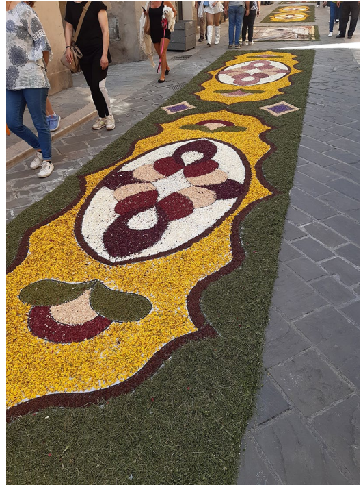
Kuva 5. Maatuvista materiaaleista tehtyjen yhteisöllisten taideteosten viitoittama reitti kaupungin kaduilla.

jen restaurointi ei ole täällä mielestäni tarpeellistakaan. Astian kokoon liimaamiseen ja alkuperäisen ulkonäön rekonstruoimiseen liittyvät käytännöt olisivat kuitenkin sovellettavissa suomalaiseseen materiaaliin. Esimerkiksi astian liimaaminen kokoon oikeanlaisella liimalla mahdollistaa liiman poistamisen tai palojen asennon säätämisen, vaikka liima pääsisi kuivumaan. Nykyiset restauroinnin periaatteet karttavat liiallista tulkintaa ja pyrkivät kunnioittamaan alkuperäistä astiaa. Esineen ulkomuodosta esimerkiksi rekonstruoidaan vain niitä piirteitä, joita voidaan varmuudella päätellä säilyneistä paloista. Sen lisäksi rekonstruoidut osat pitää pystyä selkeästi erottamaan alkuperäisistä osista, vaikkakin niiden on samalla sulauduttava häiritsemättä kokonaisuuteen.