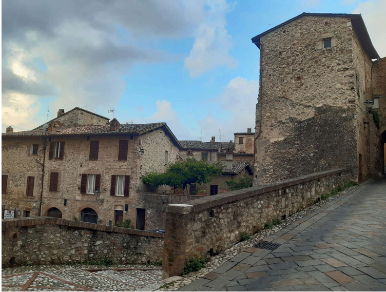
Kuva 1. San Geminin kaupungin vanhempaa rakennuskantaa.

San Geminin kaupungissa, jossa SGPS-ohjelman kurssit järjestetään, on noin 5000 asukasta. Paikalla on ollut asutusta jo esihistoriallisella ajalla sen sijaitessa keskeisen kulkureitin varrella, ja viimeistään keskiajalla kaupunki on saanut nykyisen nimensä. Kukkulan päälle sijoittuvaa kaupungin vanhaa osaa ympäröivät muurit, joiden sisäpuolta täyttävät eriaikaiset historialliset rakennukset (kuva 1). Kaupungin laajenemisesta kertovat vaihteet erottuvat rakennusten seinissä purettujen muurien ja rakennusten jäänteinä. Kaupungin vanhasa osassa on pieniä putiikkeja sekä useita ruokakauppoja ja ravintoloita. Uudempi osa San Geminin kaupunkia sijoittuu muurien ulkopuolelle kukkulan alarinteille. Siellä sijaitsee kävelymatkan päässä apteekki ja valikoimaltaan laajempi supermarket.