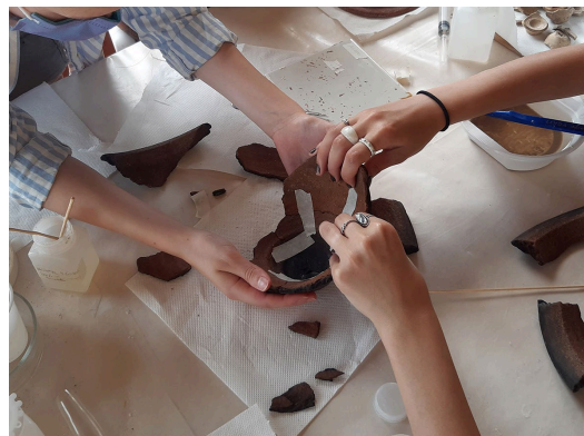
Kuva 3. Astian kokoon liimaamista yhteistoimin.