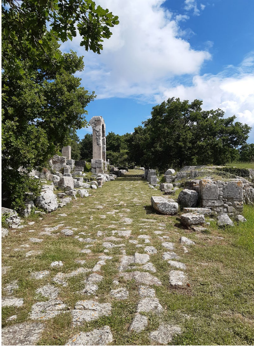
Kuva 4. Muinaisen roomalaisen kaupungin tie ja sitä reunustavia rakennusten raunioita Carsulaen arkeologisessa puistossa.

telemaan itse, sain kurssilta useita oleellisia lisäyksiä aikaisempaan osaamiseeni liittyen esimerkiksi saviastianpalojen piirtämiseen ja savimassan koostumuksen määrittelymiseen sekä tietoa valmistusmenetelmien vaikutuksesta saviastiaan. Lisäksi koin arvokkaaksi sen, että pystyin kysymään tarkentavia kysymyksiä epäselväksi jääneistä asioista opettajalta.