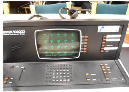
Kuva 3. Kuva Juslenian kielistudiolaitteista (TY).

Kielistudion lisäksi kielten oppimisessa yleistyivät myös muut havainnollistavat välineet, kuten kalvot ja äänikasetit. Kalvoja voitiin käyttää siten, että osa heijastettavasta kuvasta tai tekstistä peitettiin, kalvoja voitiin laittaa useampi päällekkäin ja näin modifioida opetettavaa asiaa.