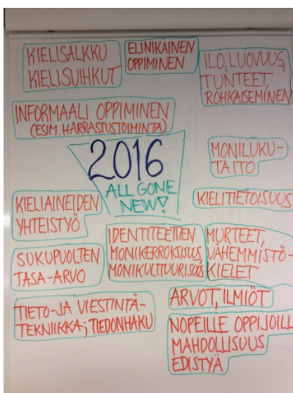
Kuva 6. Vieraiden kielten opetus uuden opetussuunnitelman mukaisesti (vieraiden kielten opetusharjoittelijat syksyllä 2014).

Oppiminen on oppijan oman toiminnan tulosta eli oppijan tulee hankkia omia fyysisiä ja älyllisiä kokemuksia kehittyäkseen. Kielten oppiminen kannattaa aina sitoa johonkin kontekstiin. Kielten tunnilla tämä tulee esille siinä, että ei opetella yksittäisiä sanoja tai kielioppisääntöjä, vaan opitaan ne aina jossakin kontekstissa (Borg & Burns 2008). Kielitiedon oppiminen sidotaan kohdekuulttuuriseen taustaan ja kohderyhmän omaan maailmaan. Peruskoulun uusissa opetussuunnitelman perusteissa korostuu vieraiden kielten kohdalla kasvu kulttuuriseen moninaisuuteen ja kielitietoisuuteen, monilukutaito ja oppiaineiden yhdistäminen (ks. kuva 6).