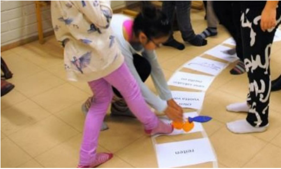
Kuva 5. Tempurata alakoulun saksan tunnilla.

tietoa ongelmanratkaisun avulla aiemmin opittua hyväksi käyttämällä ja soveltamalla. Tämä näkyy kielten oppimisessa mm. siinä, että oppijat itse löytävät kielioppisäännöt. Opettajan tehtävä on mahdollistaa löytäminen.