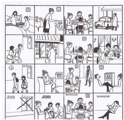
Kuva 2. Kuva 1950-luvun lopulla ilmestyneestä oppikirjasta Voix et Images de la France .

maailmansodan jälkeen. Talouden lähtiessä nousuun matkailu lisääntyi ja kielenopetus keskittyi yhä enenevässä määrin käytännön tilanteisiin vieraassa kulttuurissa, kuten esimerkiksi hotellihuoneen varaamiseen ja ravintolassa asiointiin. Kielenopetuksessa alettiin siis pikku hiljaa asettaa etusijalle käytännön kielitaito. Tätä kutsutaan tutkimuskirjallisuudessa selviytyjän kielitaidoksi (engl. language for survival , ks. Byram & Esarte-Sarries 1991). Myös yhteiskunnalliset muutokset, kuten koulutuksen demokratisoituminen, vaikutti siihen, että vieraan kielen opetus ei ollut enää yhteiskunnan eliitin yksinoikeus, vaan tuli mahdolliseksi kaikille yhteiskuntaluokille.