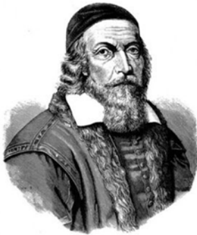
Kuva 1. Comenius.

On hämmästyttävää, miten ajankohtaisia 1600-luvulla vaikuttaneen, vieraiden kielten didaktiikan ”oppi-isän”, tšekkiläisen kasvatusajattelijan ja koulujen uudistajan, Johan Amos Comeniuksen (1592–1670) ajatukset kielten oppimisesta ovat vielä nykyäänkin (ks. kuva 1).