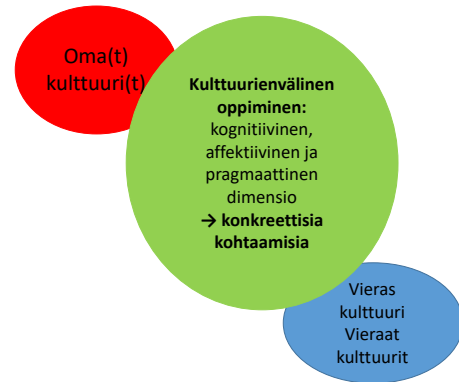
Kuva 4. Oppija kulttuurien välitilassa.

Kulttuurienvälinen oppiminen tuli vieraiden kielten opetukseen ja oppimiseen 1980- ja 1990-lukujen aikana. Erityisesti 1990-luvulla tehtiin paljon kulttuurienväliseen oppimiseen liittyviä tutkimuksia. Tutkimuskirjallisuudessa kiisteltiin erityisesti siitä, mitä kulttuurienvälisen oppimisen käsitteellä tarkoitetaan. Kun perinteisen kielenoppimisen ja kommunikatiivisen perinteen aikana lähdettiin siitä, että opitaan jotakin kohdekielistä, toi kulttuurienvälinen oppiminen oman kulttuurin sekä globaalin ja kansallisrajan ylittävän näkökulman mukaan vieraan kielen opettamiseen ja oppimiseen. Nykyään vieraiden kielten opetuksessa lähdetään liikkeelle siitä, että oppija toimii monien kulttuurien keskellä sekä kulttuurin kokijana että kulttuurien välittäjänä. Yleisesti opetuksen tavoitteena pidetään sitä, että oppijat osaavat toimia kielellisesti ja kulttuurisesti asianmukaisella tavalla kulttuurien keskelle muodostuvissa kulttuurienvälisissä tilanteissa. Kulttuurienvälisessä vieraan kielen oppimisessa tavoitteena on kehittää taitoja ja strategioita, kuinka olla kanssakäymisissä vieraiden kulttuurien kanssa. Perinteisesti kulttuurienvälisen oppimisen tavoitteisiin kuuluvat oman ja vieraan kulttuurin pohdinta (kulttuurien vertailu), herkistyminen kulttuuriin liittyville ilmiöille ja tietojen hankkiminen omasta ja vieraasta kulttuurista sekä niiden suhteista (ks. esim. Kaikkonen 2004). Ks. kuva 4.