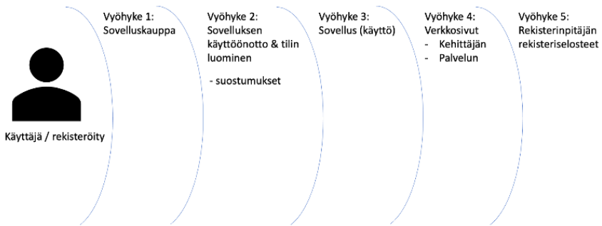
Kuva 2: Kuvaus vyöhykkeistä, joissa rekisteröityjä informoidaan.

Yhteenvetona ainoastaan kolme neljästätoista sovelluksesta täytti kaikki tässä tarkastellut saatavuutta koskevat vaatimukset eli sovelluskaupasta (vyöhyke 1), sovelluksesta käyttöönoton yhteydessä (vyöhyke 2) sekä sovellusta käyttäessä (vyöhyke 3) löytyi helposti kyseistä sovellusta koskeva tietosuojaseloste (vyöhyke ei tässä viittaa joukkoliikennelippujen maantietellisiin kelpoisuusalueisiin, vaan rekisteriselosteen digitaaliseen saatavuuteen, toim.huom.) Tuloksiin vaikutti numeerisesti se, että sama palveluntarjoaja toimi seitsemän sovelluksen osalta sovelluskehittäjänä.